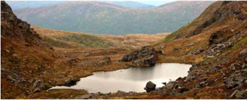
Lite badevann like ved Breiskaret.

Fra hytta går du inn i dalen vest for Stortussen. Det går delvis en sti like ved bekken som kommer ut fra dalen, Følg dalbunnen helt til du kommer opp i Breiskaret og utsikten åpner seg ut mot Tustnastabbene og forhåpentligvis en nydelig solnedgang.