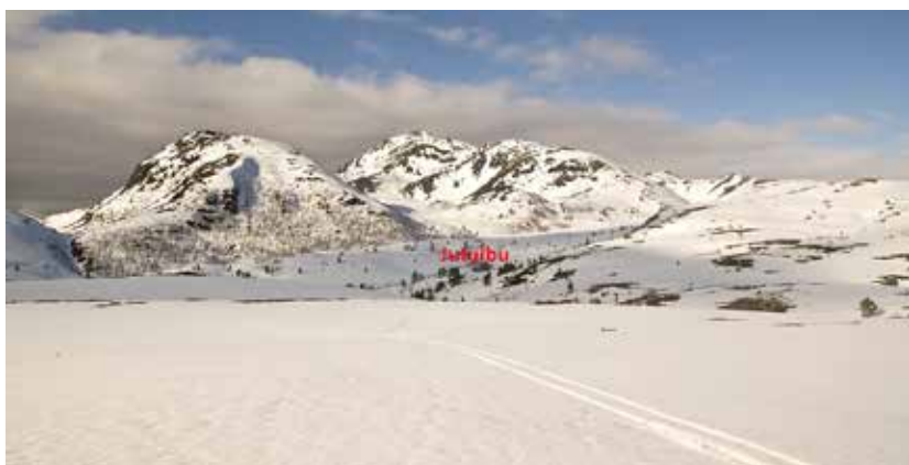
Når du kommer opp over Settemsvarden ser du hytta ved foten av Tussan.