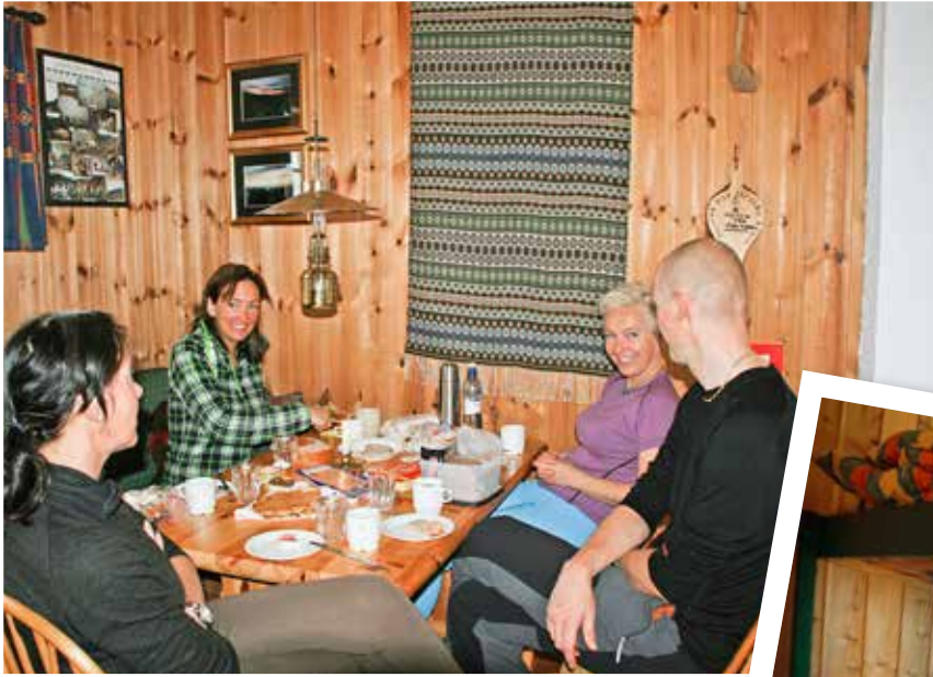
Frokost ved Jutulbu.