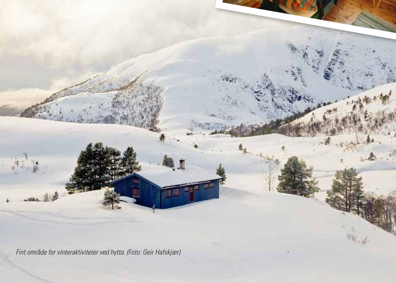
Fint område for vinteraktiviteter ved hytta.