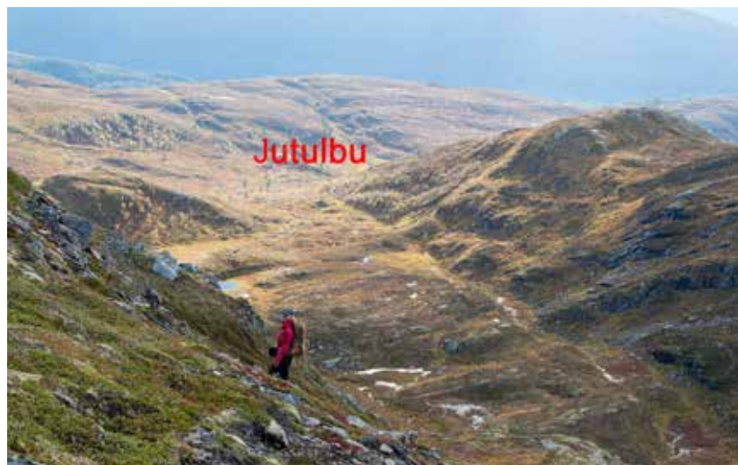
Fra toppområdet på Stortussen kan du se helt ned til Jutulbu.

Fra Stortussen er den en fin utsikt ned til Skålvikfjorden og ut til Tustna.