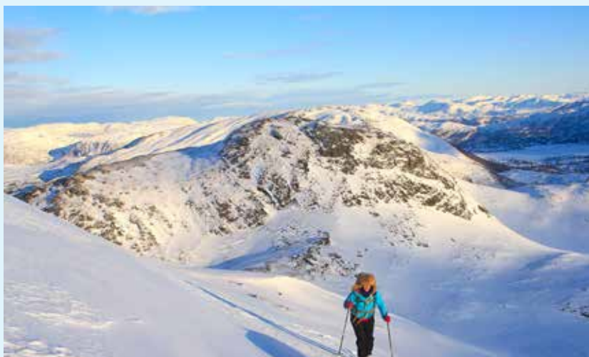
Siste kneika før toppen er over 30 grader, så det kan være litt krevende hvis det er skare.

Fra hytta går du mot Fjellslættvatnet og dreier inn i dalen nord for Fjellslættvatnet. I dalbotnen fortsetter du opp lia i vestlig retning til terrenget flater ut. Herfra går du rett mot toppen.