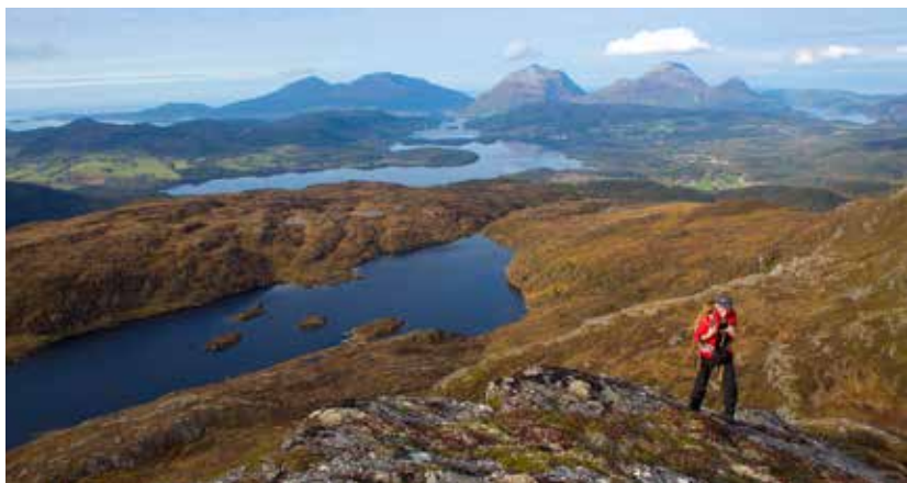
På vei over den vestligste toppen Tussan med utsikt mot Måsvatnet.

Spesielle forhold: To av nedstigningene er forholdsvis bratte, men ikke luftig.