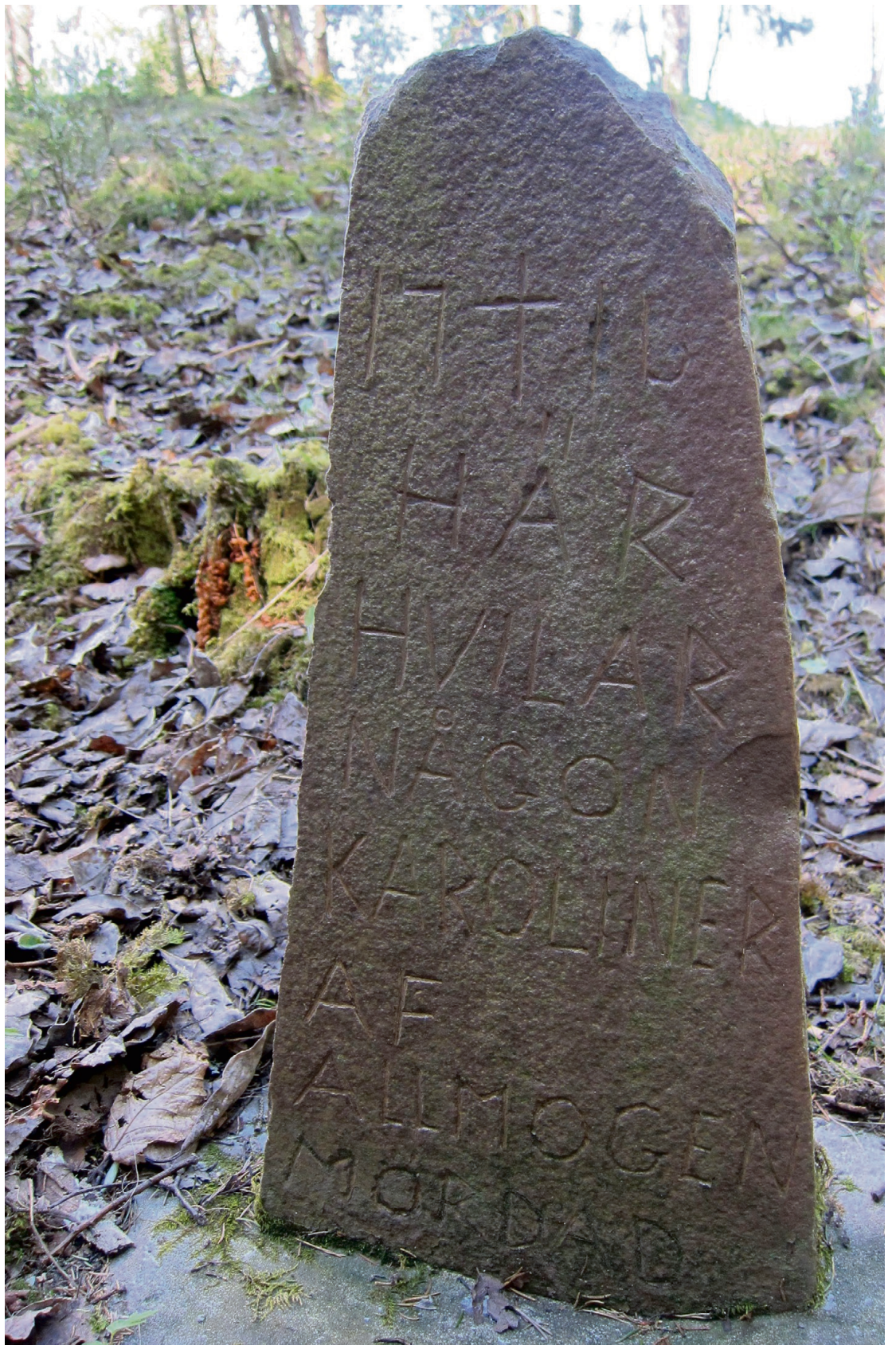
SVENSKESLAGET: På denne turen finner du minnestein over svenske soldater.

På høyre side av stien langs kalkryggen er det lerkeskog i 2-300 meter fremover. Elgen har faktisk gitt lerken gode vekstvilkår siden den har tatt knekken på alle furuskuddene. Et artig innslag i floraen er det i